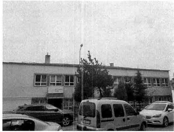
ABDULLAH BOZBAĞ İLKOKULU